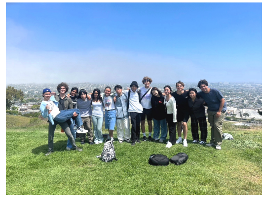
ロケットシップパークにて

正直、このプロジェクトに参加する前は、文化も言語も異なる人とコミュニケーションをうまくとれるか不安だったのだが、たとえ言語や文化の壁があろうとも仲良くなれるということを実感していた。このプロジェクトを通して最高の仲間、そして素敵なトランスの新しい家族に私たちは恵まれた。そしてこれまでサポートしてくれたすべての方々、たくさんお世話になったKIRAの方々に恩返しができるように、これからこの経験を生かしていろいろなことにチャレンジしていきたいと思う。